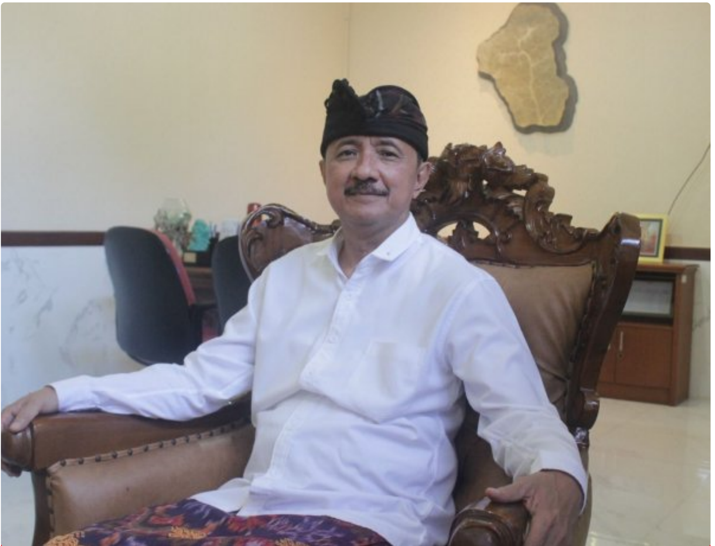
Tjok Bagus Pemayun, Kepala Dinas Pariwisata Provinsi Bali.

Oleh; Tjok Bagus Pemayun, Kepala Dinas Pariwisata Provinsi Bali